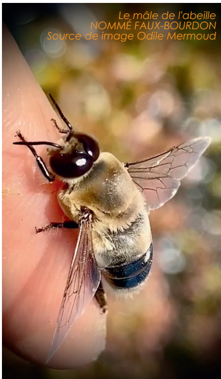
Le mâle de l'abeille NOMMÉ FAUX-BOURDON

Il est dépourvu de dard, comme tous les hyménoptères de son sexe. Comme il ne possède pas les outils propres aux travaux qu'effectuent les ouvrières, y compris le butinage, il ne participe pas aux travaux de la ruche, ne récolte ni nectar ni pollen, sa fonction essentielle constitue à la reproduction (fécondation d'une reine vierge)