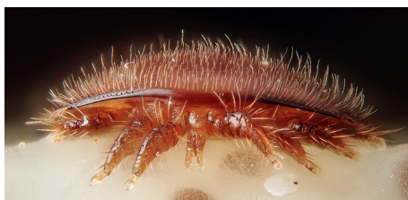
Varroa femelle adulte

À notre époque moderne, la survie des abeilles est de plus mise en péril, elle est due au parasite Varroa Destructor :